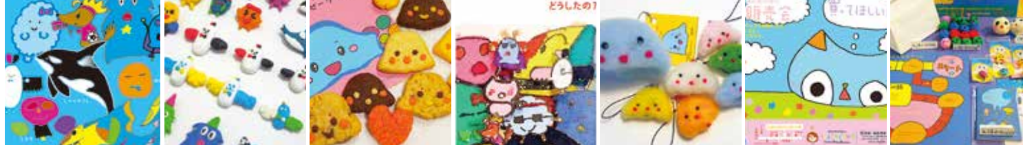
キャラクター ②グッズデザインレッスンの商品例 ピンバッジ お菓子 絵本 お人形 ポスター お店

詳しくは子どもデザイン教室TEL06-6698-4351(和田)までお問い合わせください。