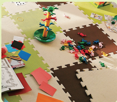
交流会のキッズスペース