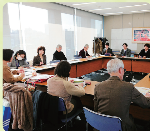
定例会を開催しています